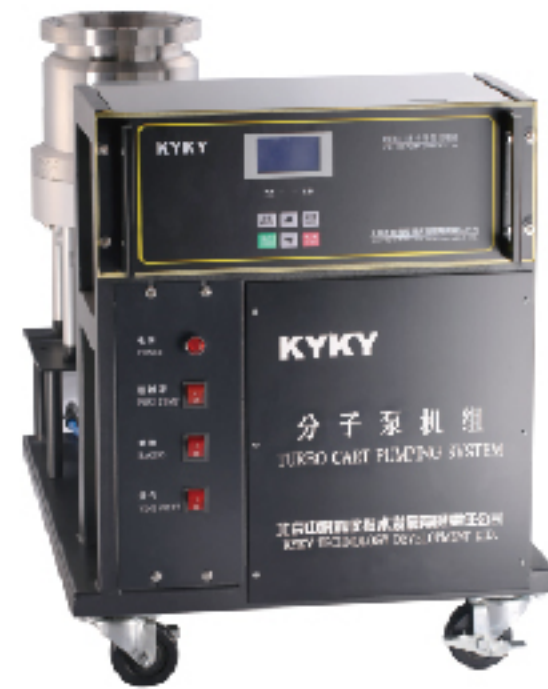
北京中科科仪股份有限公司 KYKY TECHNOLOGY CO., LTD.